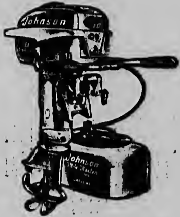
MODEL 1956 15 HORSE POWER